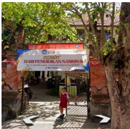
Gambar 1. Lokasi Sekolah