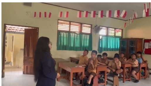
Gambar 4. Implementasi hari ke-1

Sebagai solusi atas permasalahan tersebut, dilaksanakan kegiatan sosialisasi literasi membaca dan kemampuan analisis bacaan yang bertujuan meningkatkan minat membaca sekaligus melatih keterampilan berpikir kritis siswa melalui proses analisis isi bacaan. Implementasi kegiatan dilakukan dalam dua kali pertemuan, yang dirancang untuk memberikan pemahaman konseptual sekaligus pengalaman praktik bagi siswa-siswi. Pada pertemuan pertama, tim pelaksana memberikan materi sosialisasi mengenai pentingnya literasi membaca dan analisis bacaan. Siswa-siswi diperkenalkan pada pemahaman bahwa kegiatan literasi tidak hanya sekedar membaca rangkaian kata atau kalimat, tetapi juga memahami makna, informasi, dan pesan yang terkandung di dalam setiap bacaan. Melalui pendekatan ini, siswa diharapkan menyadari bahwa setiap teks memiliki nilai pengetahuan yang dapat memperluas wawasan dan membentuk cara berpikir yang lebih kritis serta reflektif dalam proses pembelajaran.