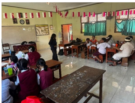
Gambar 5. Implementasi hari ke-2

Kegiatan implementasi ini diawali dengan penyampaian materi mengenai pengertian membaca dan analisis bacaan, tujuan dan manfaatnya, serta langkah-langkah yang dapat dilakukan dalam menganalisis isi bacaan yang dijelaskan pada gambar 4.1. Materi yang diberikan interaktif juga diselingi dengan ice breaking untuk menumbuhkan semangat serta antusiasme siswa-siswi. Kemudian, setiap siswa-siswi menerima satu teks bacaan yang berbeda untuk dianalisis. Aspek-aspek yang dianalisis mencakup tema, tokoh dan sifatnya, alur, konflik dan solusi, serta pesan moral yang terkandung dalam bacaan.