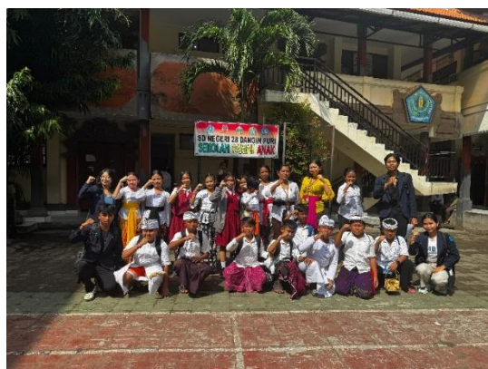
Gambar 6. Foto Bersama

Secara keseluruhan, kegiatan implementasi ini berjalan dengan lancar dan sesuai tujuan proyek serta mendapatkan respon yang positif dari siswa-siswi. Antusiasme dari siswa-siswi terlihat saat menyimak materi, menjawab pertanyaan, hingga menyelesaikan tugas yang diberikan.