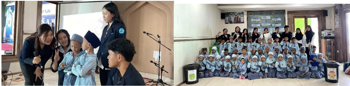
Gambar 2. Penyampaian materi edukasi kepada anak-anak TK RA Nariyah

Penggunaan media pembelajaran berupa video animasi dan presentasi bergambar terbukti mampu menarik perhatian anak-anak dan memudahkan mereka dalam memahami materi. Hal ini sejalan dengan karakteristik anak usia taman kanak-kanak yang cenderung lebih mudah menyerap informasi melalui rangsangan visual dan audio. Praktik langsung memilah juga memberikan pengalaman nyata yang memperkuat pemahaman konseptual serta mendorong terbentuknya kebiasaan positif dalam menjaga kebersihan lingkungan.