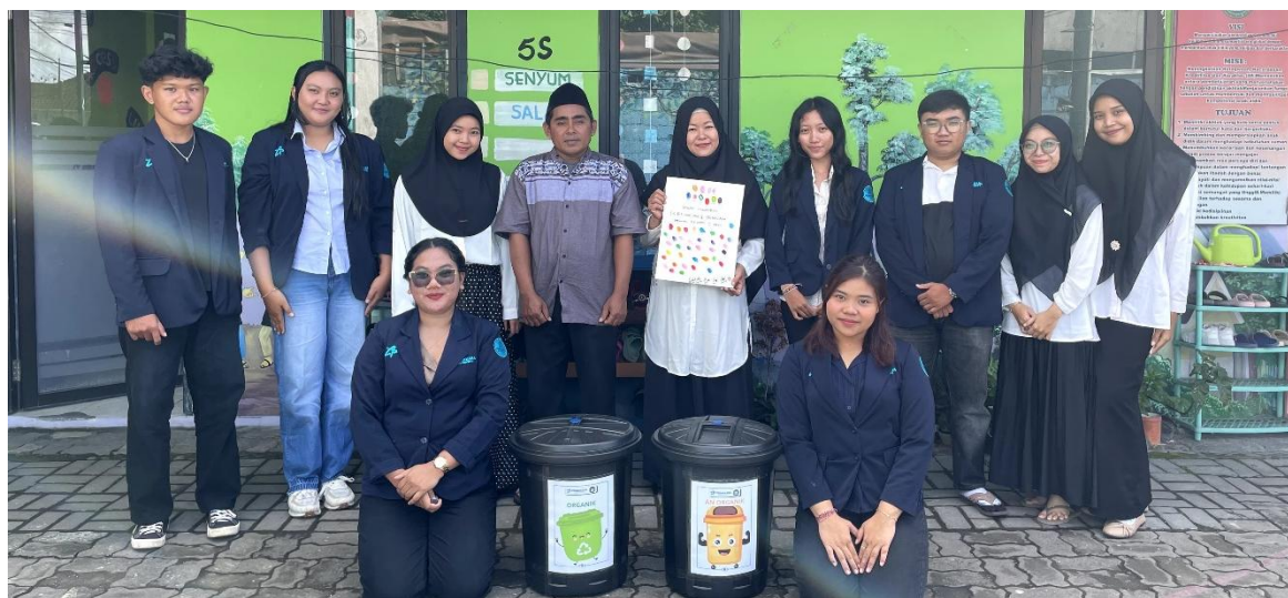
Gambar 3. Penyediaan fasilitas tempat sampah organik dan non-organik

Penyediaan fasilitas tempat sampah organik dan non-organik turut memberikan kontribusi nyata terhadap keberhasilan program. Dengan tersedianya sarana yang memadai, anak-anak memiliki media pendukung untuk menerapkan pengetahuan yang telah diperoleh dalam aktivitas sehari-hari. Lingkungan sekolah menjadi lebih bersih dan nyaman, serta bau tidak sedap di sekitar area sekolah mulai berkurang. Kondisi ini menunjukkan bahwa edukasi yang disertai dengan penyediaan fasilitas pendukung mampu memberikan dampak yang lebih berkelanjutan.